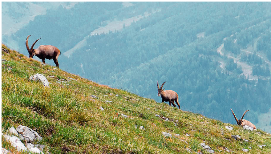
Steinböcke sind am Piz Lad häufig zu beobachten.